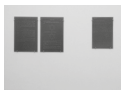
10 - Matthias Sohr, Black on printed circuit board , vernis sur cuivre, résine époxy, fibre de verre, 152,5 x 228,5 x 3,2 mm chacune, 2014