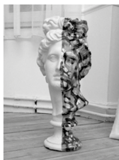
7 - Lin-Xu, La enferma , Huile et acrylique sur plâtre, 26 x 26 x 58 cm, 2011