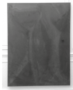
8 - Fiona Mackay, Dark Humour , acrylique sur toile, 175 x 135 cm, 2014