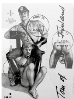
2 - Tom of Finland, timbres, édition Itella Posti, 2014 (graphisme Timo Berry), coll. Benjamin Husson