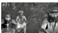
3 - Sylvie Fleury, Cristal Custom Commando , 2008, Courtesy: Sylvie Fleury / Chanel Mobile Art