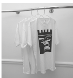
4 - Alistair Frost, impression numérique sur tee-shirts, édition limitée, 2014