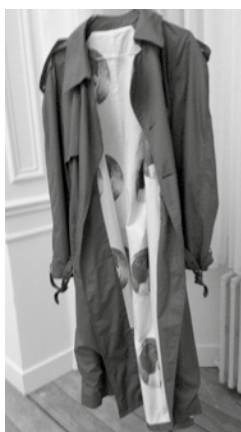
6 - François Lancien-Guilberteau, Sans titre , 2014, trench-coat doublé d'un tissu reprenant le motif d'un papier peint.