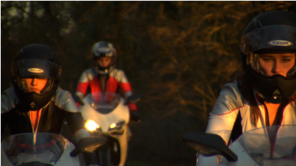
Timbres, Tom of Finland, édition Itella Posti, 2014 (graphisme Timo Berry), coll. Benjamin Husson

L'exposition Toute la Forêt présente la vidéo Cristal Custom Commando, édité avec l'aide de Chanel. Parodie des films de motards féminins des années 1960, le film montre trois motardes tirant sur des sacs de la marque au moyen d'armes automatiques.