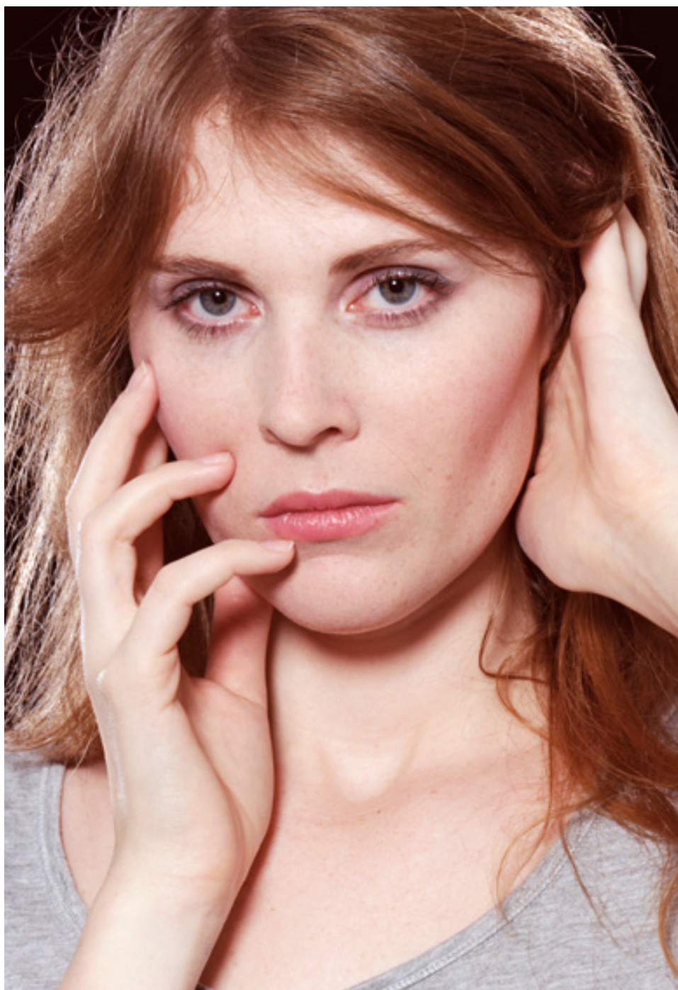
Matthias Gabi Beauty (Amelie), 2010, 2014

La série Beauty est migratoire : elle investit des champs de diffusion variés (expositions, panneaux d'affichage...). Beauty (Amelie) est une image utilisée uniquement pour les documents de communication et de médiation de l'exposition. Elle est la trame visible de l'exposition, et en même temps absente dans l'espace. Matthias Gabi est né en 1981 à Berne, et vit et travaille à Zurich, en Suisse. Diplômé de l'ECAL en 2013, il a également été élève de Thomas Ruff à la Kunstakademie de Düsseldorf en 2007.