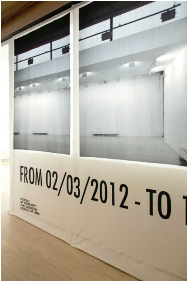
From to impression sur tissus 3 x 320 x 180, 2012 The Grace and Clark Fyfe Gallery, The Glasgow School of Art.